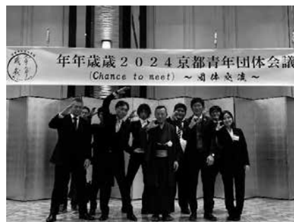
【京青中メンバーで記念撮影】