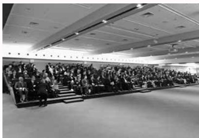
講演会・事業報告風景