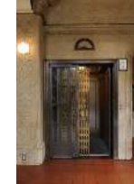
日本最古のエレベーター