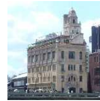
スパニッシュ・バロック様式の洋館