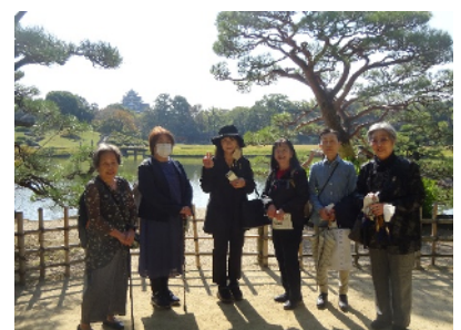
午前中は、岡山城と岡山後楽園を見学。昼食には岡山の郷土料理「岡山ばらずし」をいただきました。さすが「晴れの国岡山」。とても良いお天気でした。