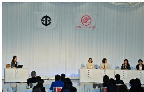
パネルディスカッション 『岡山県ものづくり女性中央会の取組 ～会員から地域へ、次世代へ～』