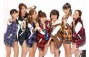
公式応援団 アップアップガールズ(仮)