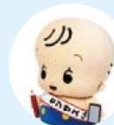
国勢調査 イメージキャラクター センサスくん