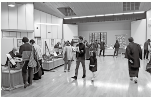
オープンファクトリーの風景