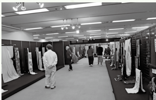
西陣織大会の風景

「西陣織製品の販路開拓並びに需要拡大に向けた展示会の開催」をテーマとして、令和7年度に西陣織工業組合が全国中小企業団体中央会の公募事業「中小企業組合等活路開拓事業」を活用された事例を紹介します。